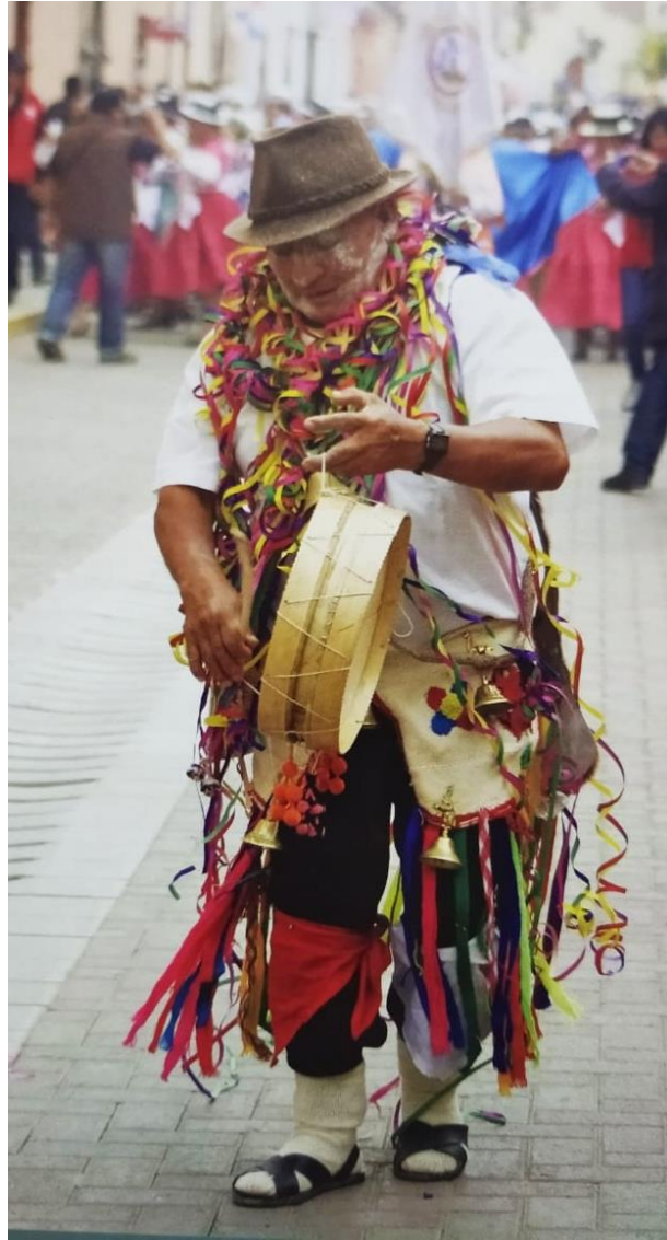
Pasión por los carnavales, docente umarino "Sauramino" Personaje del Ño Carnavalón Huamanguino.

Una primera vertiente de la influencia del carnaval cangallino en Huamanga, fueron a través de sus estudiantes secundarios antes de los años 60 y universitarios a partir del funcionamiento de la Universidad San Cristóbal. Muchos de ellos egresados del C.N.M. "María Parado de Bellido" (Cangallo) o la G.U.E. "Mariscal Cáceres" (Huamanga), quienes ya se habían organizado en un frente denominado "Estudiantes Unidos de Cangallo", así como otros grupos de estudios, artísticos y deportivos, aunque en un primer momento no alcanzaron mayor influencia y trascendencia.