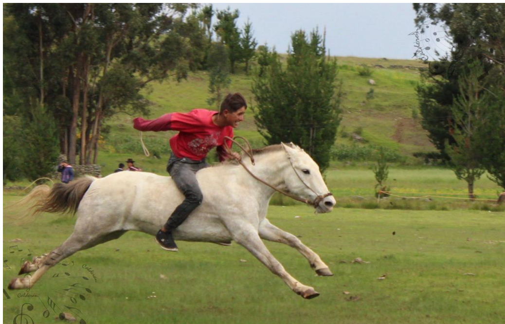
Tradición equina que se mantiene vigente a través de los carnavales.

competencias hípicas, una joya para la el distrito cangallino digno de preservarse.