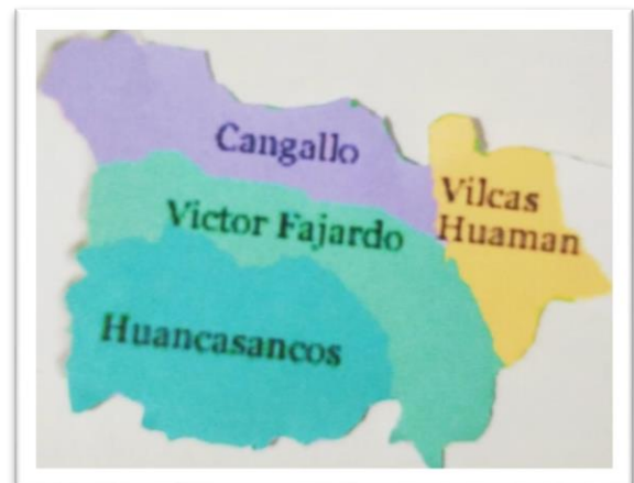
Mapa político del departamento de Ayacucho.