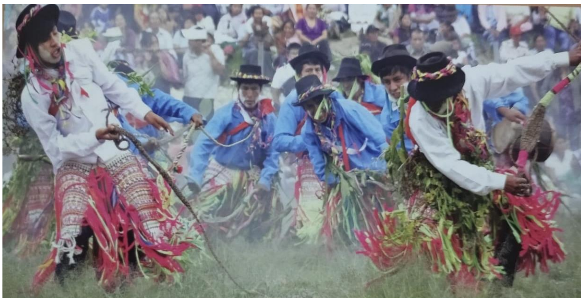
Fuerza, algarabía, regocijo y derroche carnavalero, el ADN pampamarquino en su esplendor.

En la década de los años 50, 60 y 70, las competencias de los carnavales en Pampamarca, representaba el espacio cultural de máxima expresión para las comunidades campesinas y mestizas participantes en ella, principalmente de los distritos ubicados en la parte Este de la antigua provincia de Cangallo. Constituía el centro de fuerte atracción regional, en el que también participaban personas venidas desde Lima, Huamanga y otros departamentos. Se decía que el mejor carnaval y las mejores nuevas canciones se hallaban en este lugar, por tanto desde ese espacio festivo, se difundía a gran parte de la provincia y provincias vecinas.