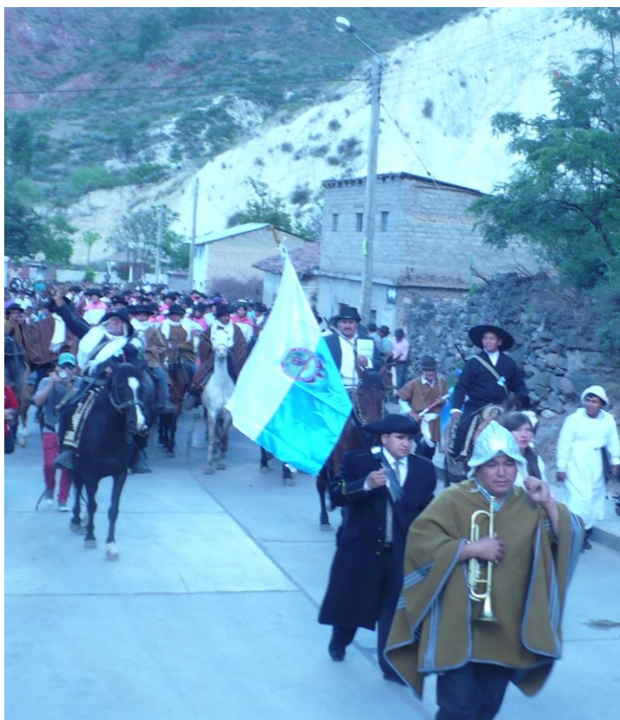
Caballería morochuca y sus líderes, rumbo a la Plaza Mayor de Cangallo para realizar el acto de escenificación de la jura de la Independencia.

Conmemoración cívica declarada por ordenanza municipal desde el año 2011, como el Día Jubilar de la Provincia de Cangallo, en homenaje a la Jura de la Independencia de Cangallo, realizada en esta ciudad el 7 de octubre de 1814, como consecuencia de la rebelión de los cuzqueños hermanos Angulo y Pumacahua.