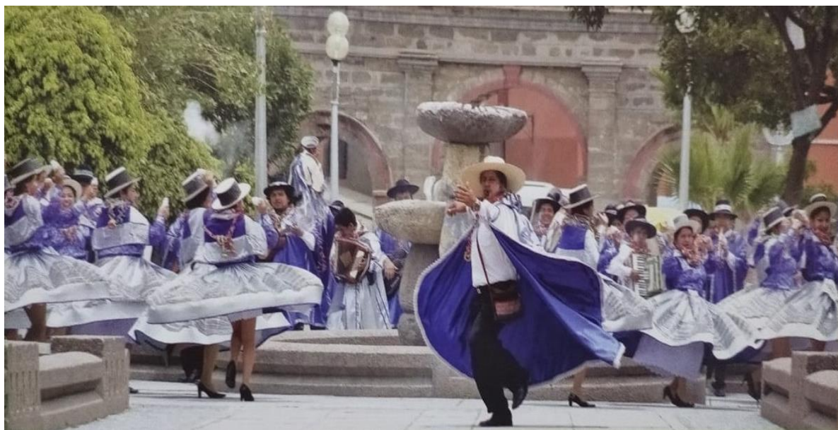
“Vamos, vamos a Cangallo, llega el Bicentenario, gloriosos morochucos, patriotas constantes y valientes” (Foto cortesía: José Luis Gutiérrez G.).

visitantes, la música avanza, salir de la monotonía, darle cadencia y realce ... hemos roto esquemas, la comparsa va continuar, no todo es maravilla, nadie nos financia, nos auto sostenemos ... exhortar a las autoridades apoyar a los carnavales, al alcalde provincial de Huamanga, las pistas de sus calles son un desastre, muchos se han accidentado... mucha diferencia con la organización de Andahuaylas ...”.