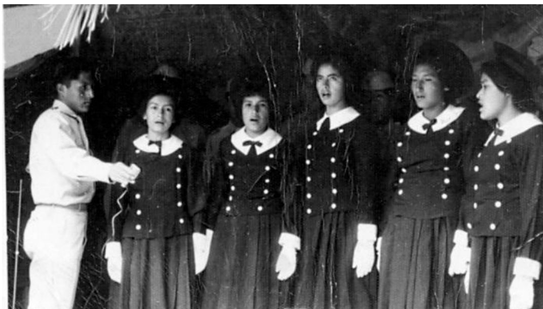
Primer Coro del C.N.M. “María Parado de Bellido”, año de 1964.

Inicialmente la creación del C.N.M. “María Parado de Bellido” (colegio secundario estatal), que en su primer año de funcionamiento convocó a 70 alumnos y una plana docente de cinco profesores, incrementándose cada año dicho número. Asimismo, la creación de la Escuela Normal Superior “Basilio Auqui” de Cangallo, trajo consigo la presencia de nuevos estudiantes y profesionales con un bagaje cultural y modo de vida, que sumaría al aportado por los paradinos.