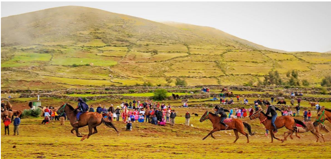
Competencia hípica en los carnavales de Pampamarca.