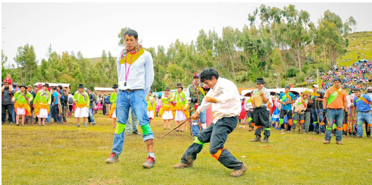
El seqollo en Huancapuquio, ritual carnavalero rural.

mismo género y edad, se enfrentan al rigor de los proyectiles (frutos verdes como el nogal, lúcuma o tunas verdes) que se lanzan con la waraca recíprocamente y por turnos. Los protocolos de la organización del warakanakuy, exigen previo a la escena, la designación de un capataz y el establecimiento de las reglas de participación, para su cumplimiento entre los competidores. Muchos autores coinciden que el warakanakuy está asociado al ciclo productivo agrario.