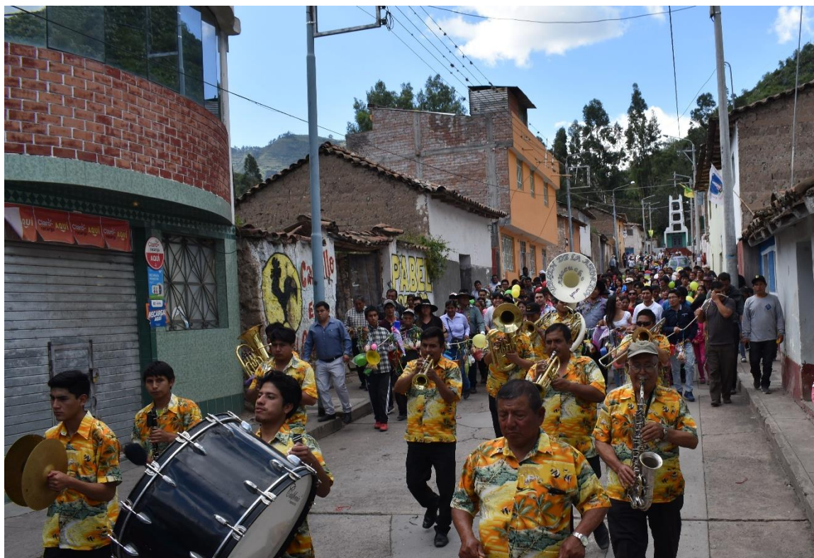
Dia de las Comadres, ingreso masivo a la ciudad de Cangallo, 2019.

al local municipal que quedaba en lo que hoy funciona el Banco de la Nación, donde se realizaba una fiesta general. En esa época no existía el cortamonte, este recién apareció por los años 1960, donde los comerciantes huamanguinos plantaron uno en medio del parque, de ahí se generalizó, en los siguientes años.