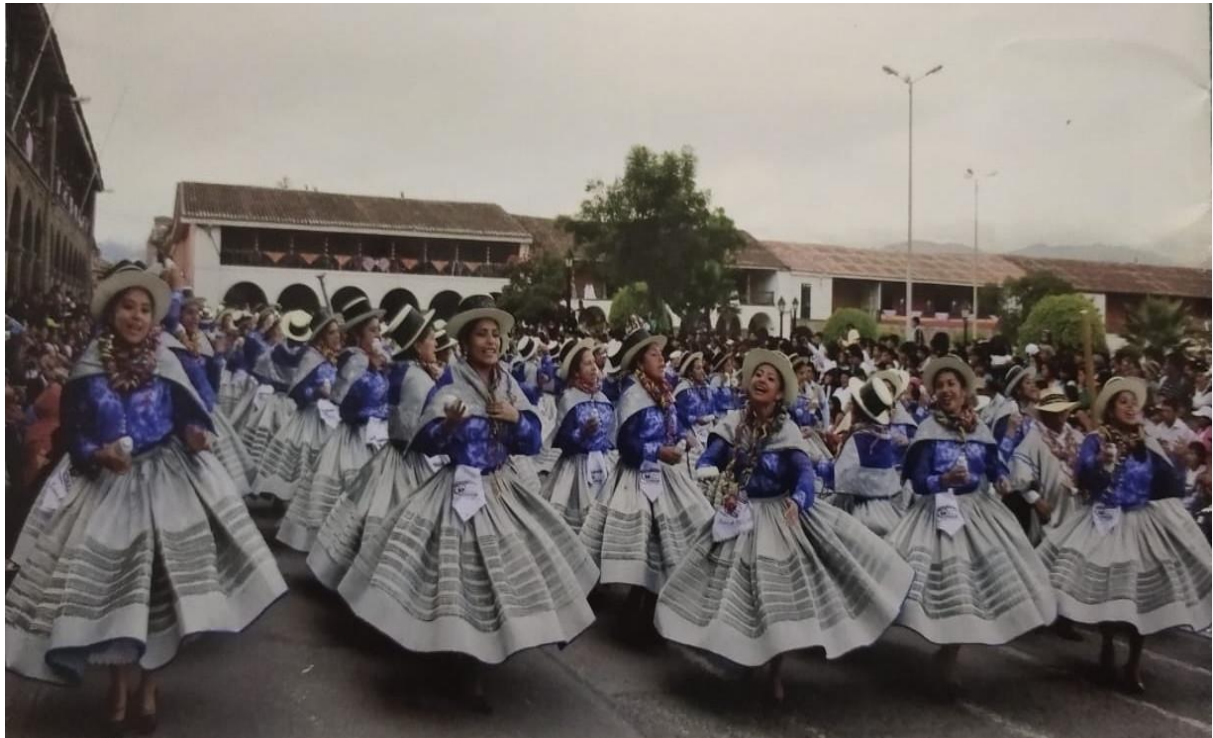
Estilo, belleza y tradición, derroche de expresión y elegancia cangallina.