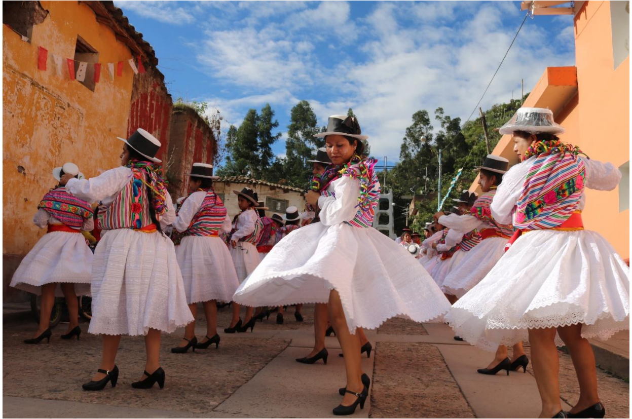
Ingreso de una comparsa tradicional cangallina, en domingo de carnaval. (Foto: Jorge Saez M.).