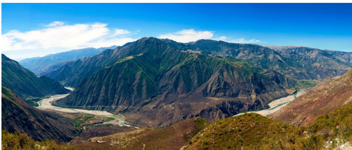
Río Pampas, panorámica tomada desde San Francisco de Pujas, Vilcas Huamán.

Esta condición político, administrativo y social de Cangallo, la privilegió en gozar de sus habitantes “ciudadanos cosmopolitas” con diferentes culturas y modos de vida, que ostentaban cada uno por el origen de sus procedencias, muchos de ellos de los distritos aledaños a la cuenca hidrográfica del río Pampas, de diferentes departamentos del país y pueblos del ande ayacuchano, donde se desarrolló una nutrida e importante interinfluencia cultural y se vivió su esplendor por varias décadas.