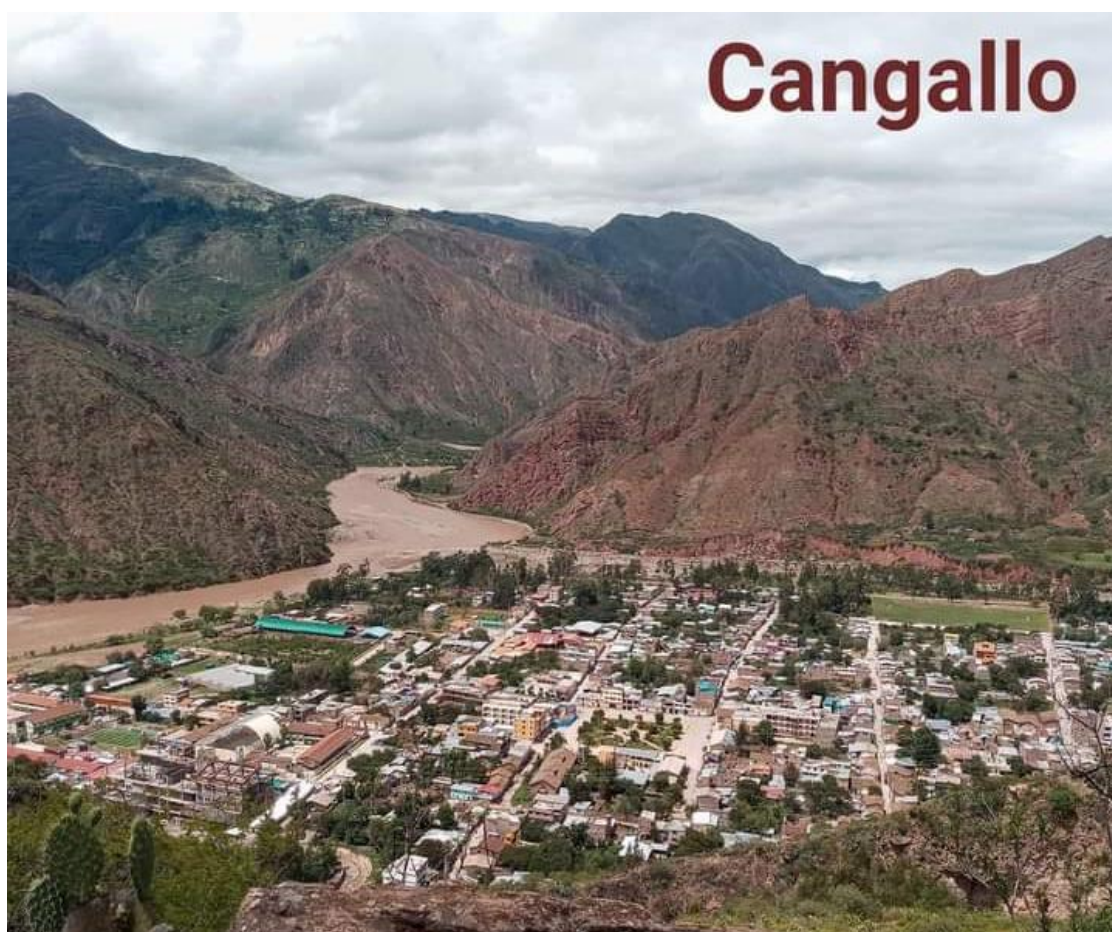
Histórica Ciudad Santa Rosa de Cangallo, bañada por el río Pampas. (Foto: A. Yuyali).

Durante la República, sufre el fraccionamiento de su territorio provincial, creándose a partir de ella, las actuales provincias de Fajardo (creada el 14-11-1910), Huanca Sancos (creada el 20-09-1984, dividida de Fajardo) y Vilcas Huamán (creada el 24-09-1984). El distrito de Ocos (lugar de nacimiento de Andrés A. Cáceres) es anexado a Huamanga, el año de 1936.