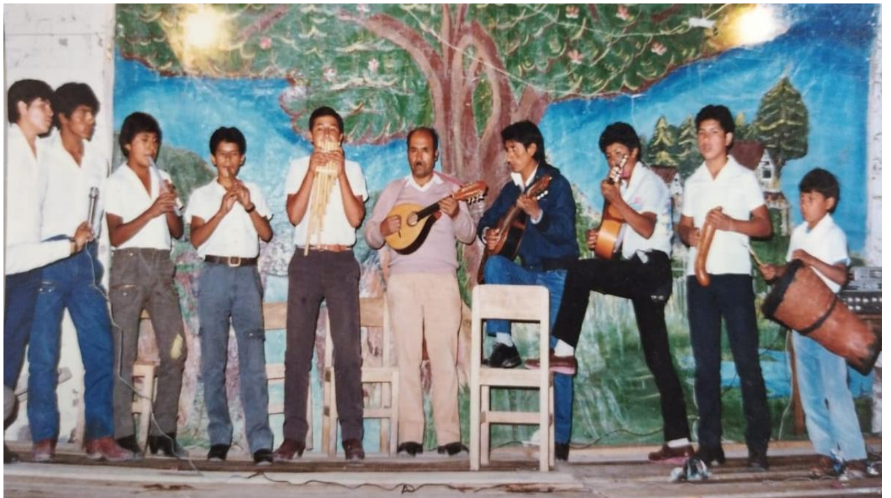
Conjunto musical paradino del año 1977, en una presentación pública. (Foto: Eleodoro Gómez M.).