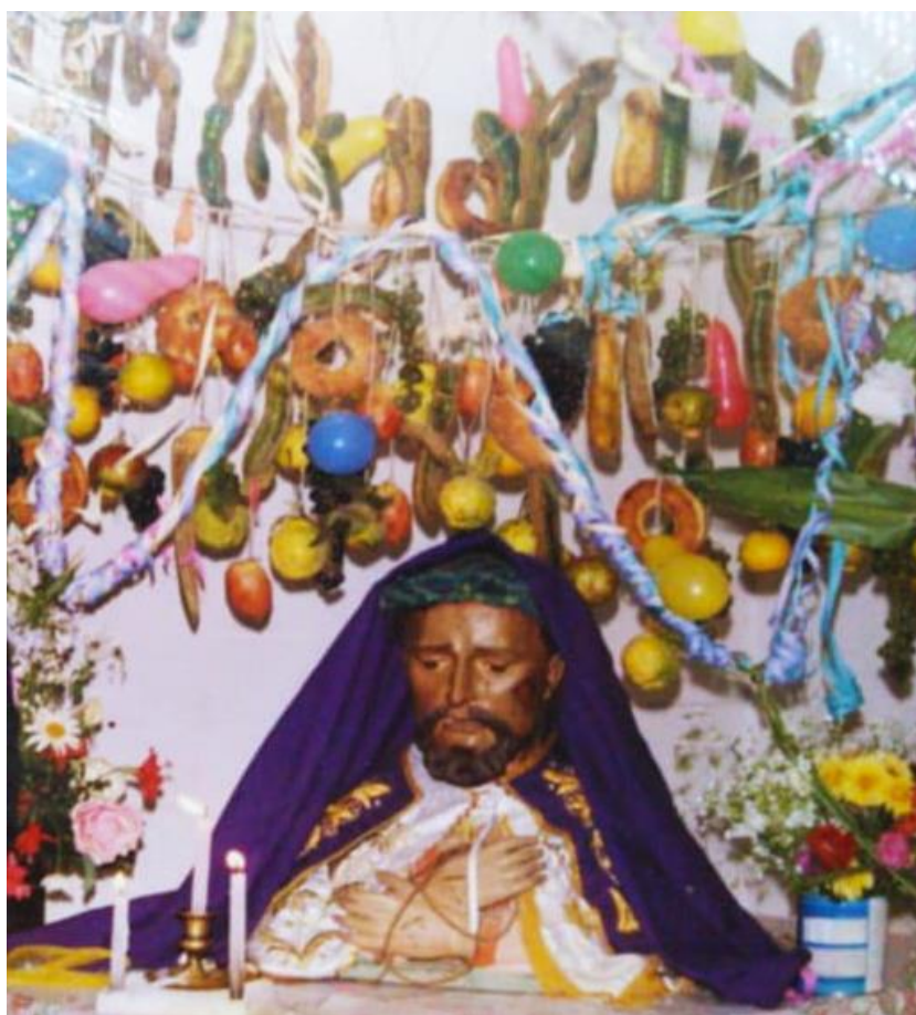
El Señor de la Caña, patrón del Fundo Chaka, el watakuy expresado en los Quilles.