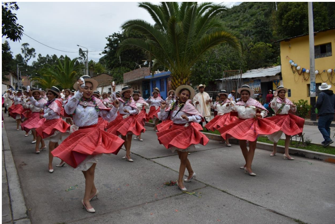
Participación de la comparsa Cangallo Corazón, en el Ño Carnavalón 2018 de Cangallo. (Foto: Jorge Saéz M.).

e instrumentos musicales como la tinya, quena, esquila, silbato, guitarra y quijada de burro. Los instrumentos de cuerda eran escasos, por el que también eran pocos los aficionados que tocaran dicho instrumento.