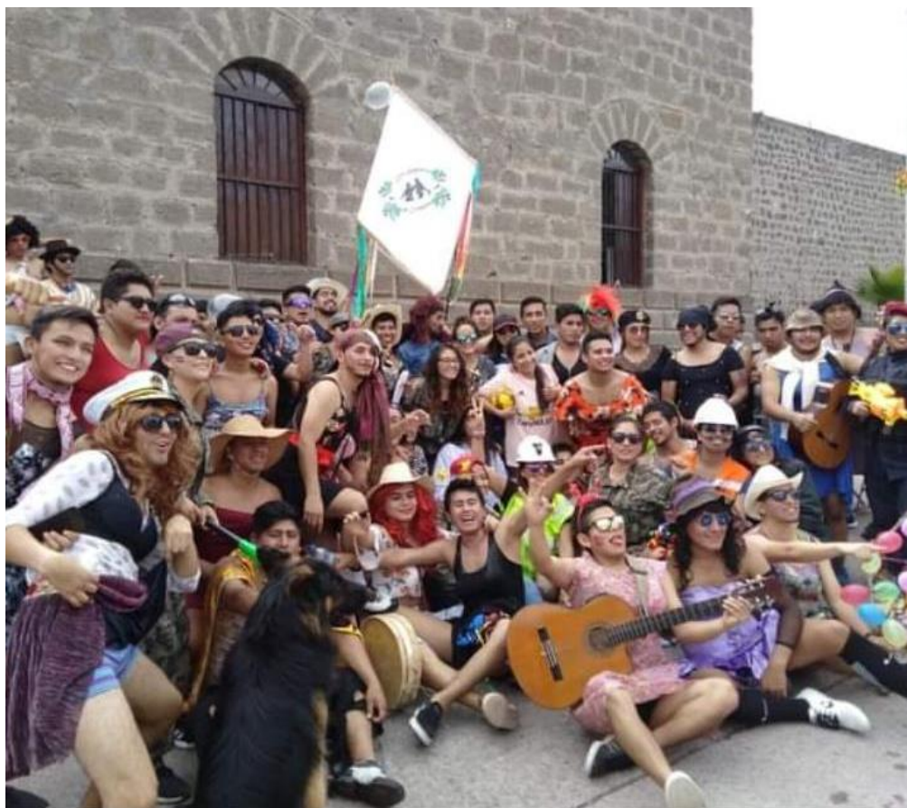
Despidiendo los carnavales 2020, “Los Qaylacos”.