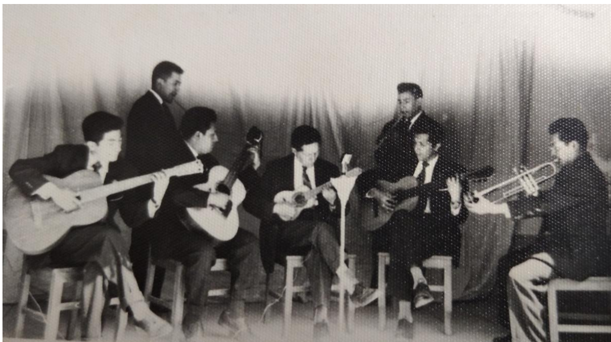
Estudiantina paradina, calidad, elegancia y compromiso profesional, imagen del año de 1963.

La riqueza e interpretación musical es recordada hasta hoy, sobre todo es el inicio de las influencias que recibe la ciudad capital a través de este colectivo musical, que su repertorio salió de las aulas paradinas al espacio social cangallino, impactando con sus presentaciones artísticas profesionalmente logrado.