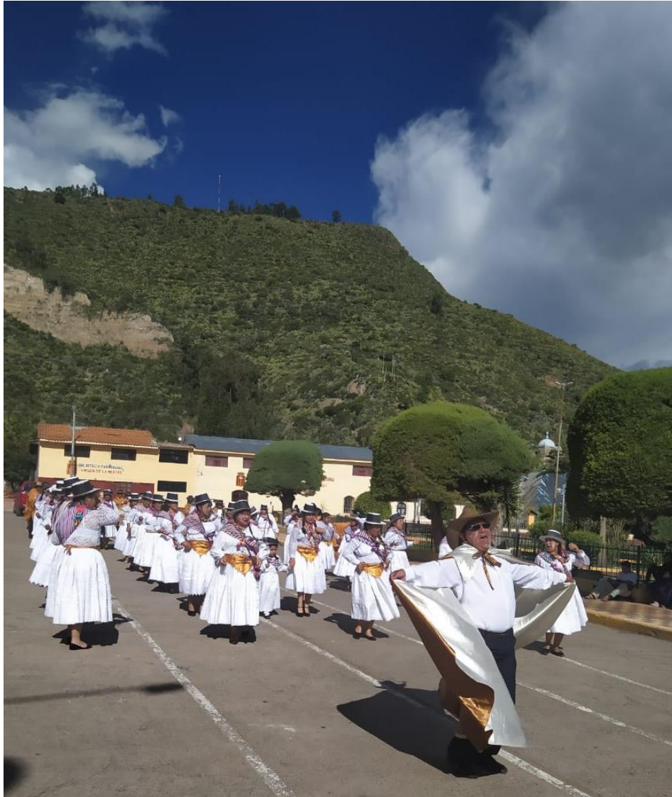
“Los Mensajeros de Cangallo”, más de 50 años fomentando identidad. (Foto: Cortesía familia Chuchón Quispe).