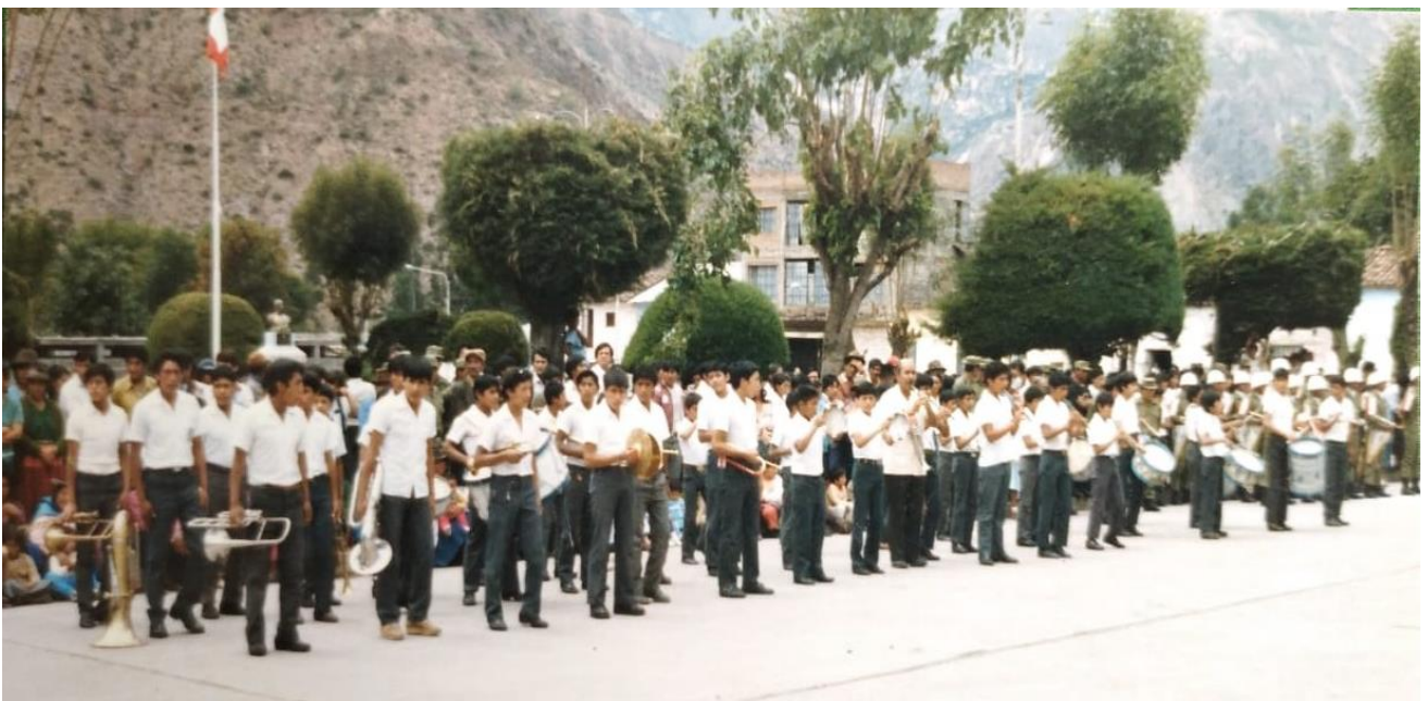
Presencia musical cívica de Paradinos en fiestas patrias de 1980, nótese: banda de música, orfeón de quenas y banda de guerra.