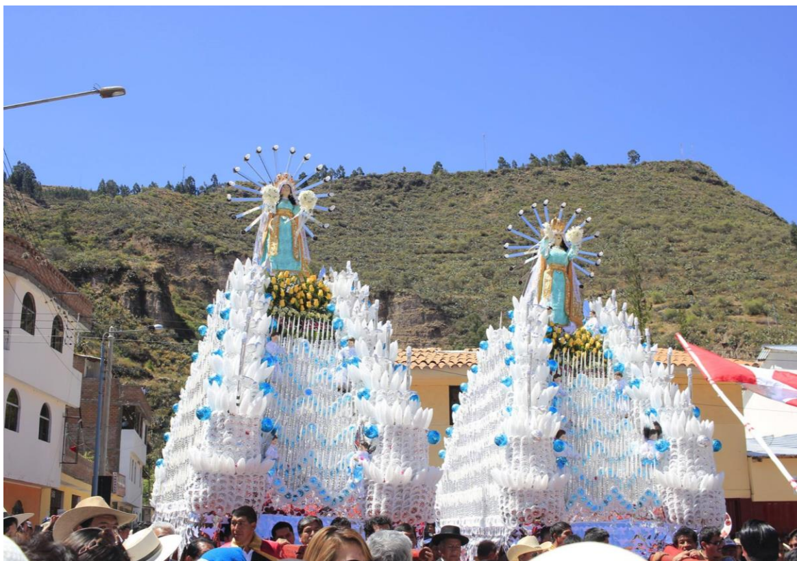
Fiesta religiosa de la Virgen de la Asunción, patrona de Cangallo.

Es una fiesta religiosa devocional, denominada también como “Mamacha Asunta”, se desarrolla en honor a la Virgen de la Asunción patrona de la ciudad de Cangallo, durante los días 14 al 17 de agosto de cada año.