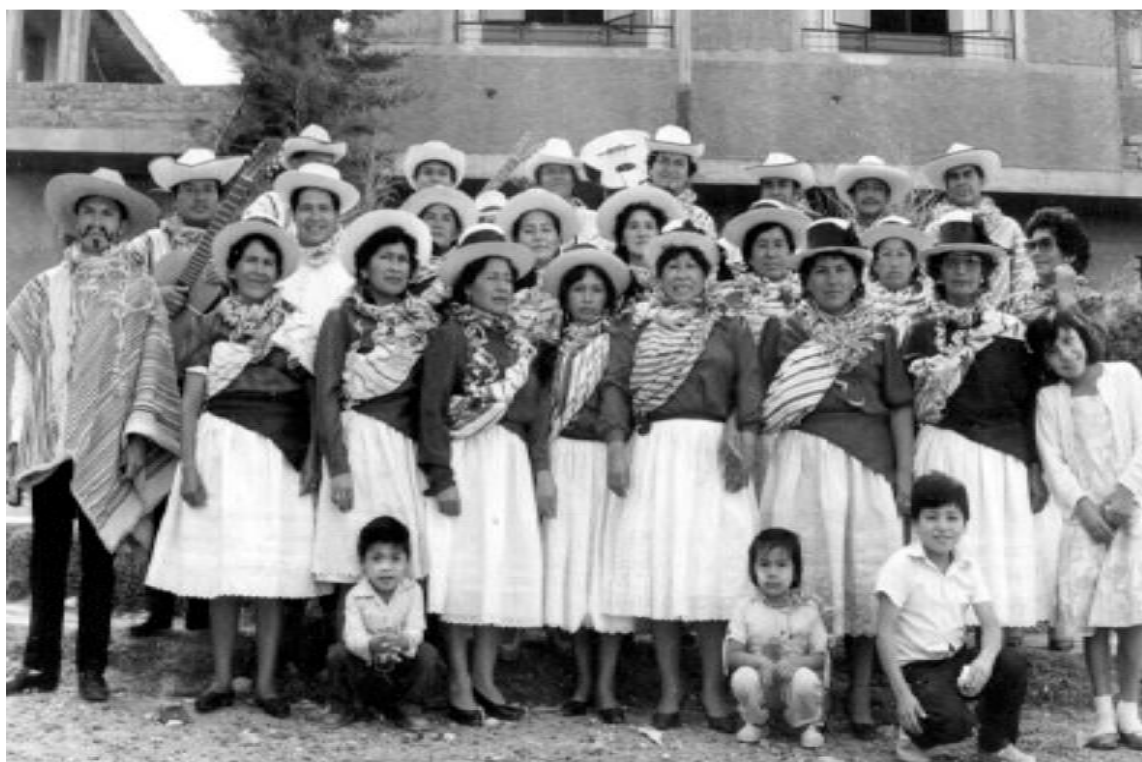
La comparsa “Cangallo Corazón” inicios de su organización.

Una de las características que también ostenta esta comparsa, es que tiene una cantera de compositores que año a año se disputan el privilegio de que sus nuevas canciones sean seleccionadas y debutadas en la fiesta carnavalera entrante.