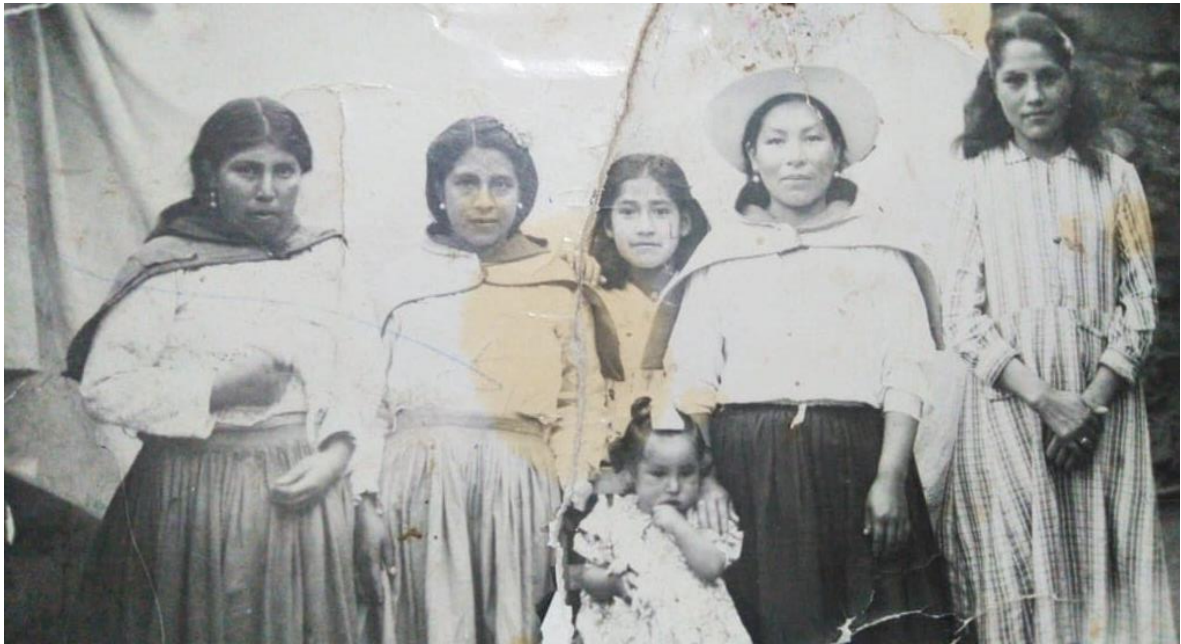
Familia umarina del año de 1953, las damas mayores con su vestimenta cotidiana de influencia huamanguina, incluido su sombrero típico. Nótese en la dama del extremo izquierdo, porta una cartera de cuero.