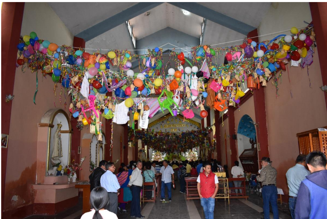
Armado de quilles en la iglesia Matriz de Cangallo, Día de Comadres, 2019.

dedicarles sus canciones y por costumbre eran atendidos por sus propietarios, generalmente personas de vejez avanzada, con chicha y licor. Esta actividad le otorgaba un componente más religioso, que el realizado en las zonas rurales.