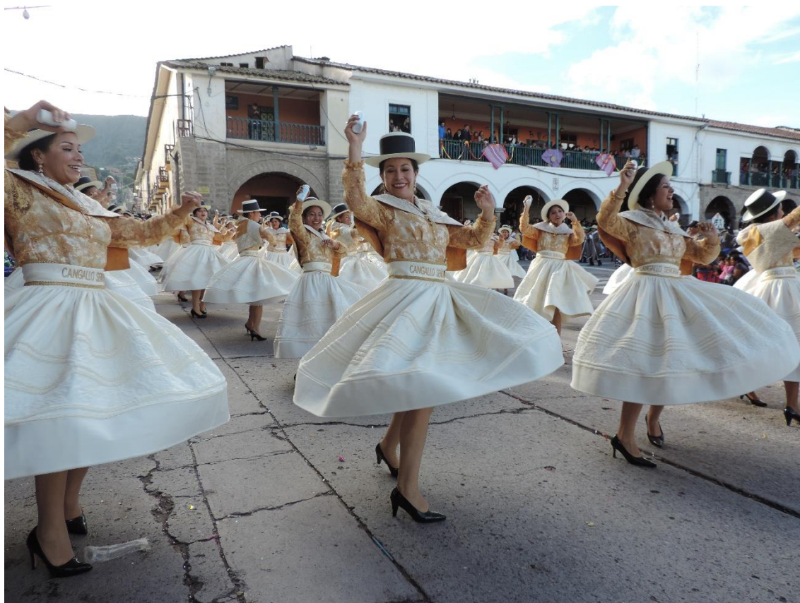
“Cangallo Señorial”, haciendo su paso de gala por la Plaza Mayor de Ayacucho.