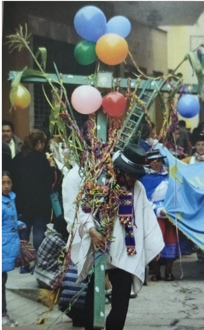
El lado sacro del carnaval, las cruces también se hacen parte de la fiesta. (Foto cortesía: José Luis Gutiérrez G.).

Antes de los años 60, las celebraciones de los carnavales en el distrito de Cangallo, se desarrollaban las siguientes expresiones culturales tradicionales: Armado de altares “Watakuy”, comparsas carnavaleras, warakanakuy, seqollo y carreras de caballo, el mismo que lo abordamos.